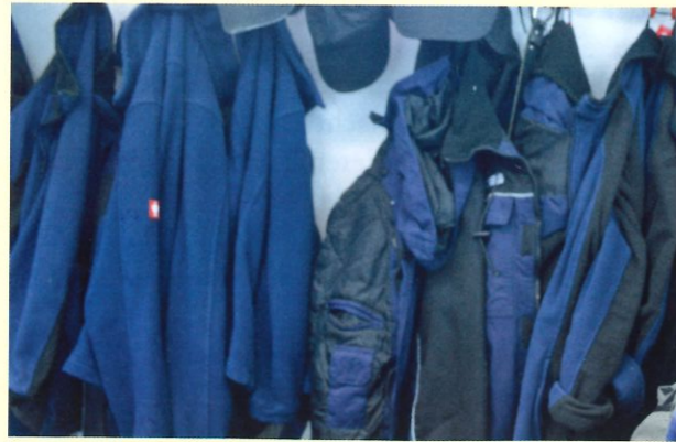
Betreten der Ställe ausschließlich in Stallbekleidung