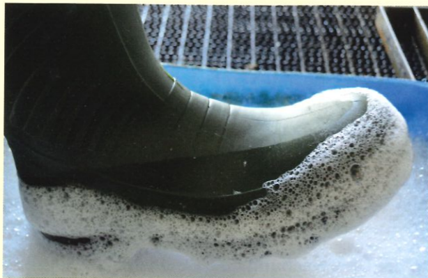
Reinigung und Desinfektion der Stiefel vor und nach dem Betreten des Stalls